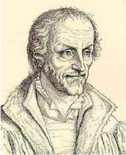
Philipp Melancthon - 1497-1560

D er Humanist, Reformator und Lehrer Deutschlands wird im Jahr 2010 zu seinem 450. Todestag vielfach geehrt. Schon zu Lebzeiten wurde ihm der Ehrentitel „Praeceptor Germaniae“ (Lehrer Deutschlands) verliehen. Die Wirkung seiner pädagogischen Schriften und Aktivitäten reichte jedoch weit über die Grenzen Deutschlands hinaus, so dass man ihn durchaus auch „Praeceptor Europae“ nennen könnte.